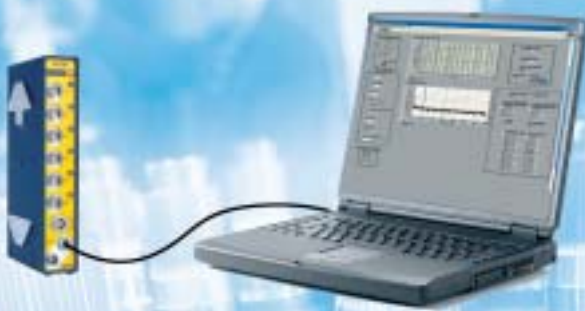
Miniature system Geringe Kanalanzahl

Single module system for direct link to the PC via USB „Einmodul“-System zum direkten PC Anschluss über USB