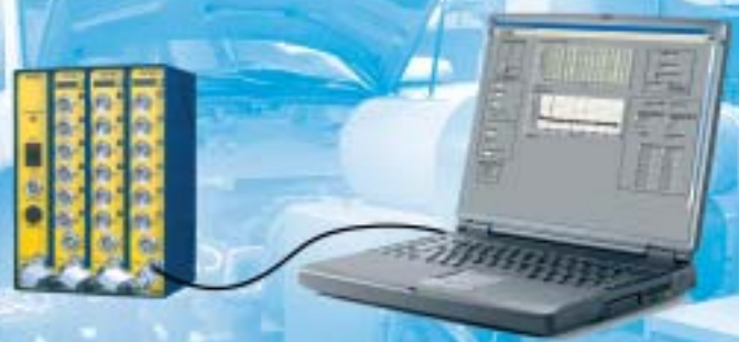
Compact system Kompaktsystem

Single module system for direct link to the PC via USB „Einmodul“-System zum direkten PC Anschluss über USB