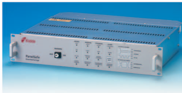
Master / Basisgerät Einschubversion zur Montage in einem handelsüblichen 19"-Schrank