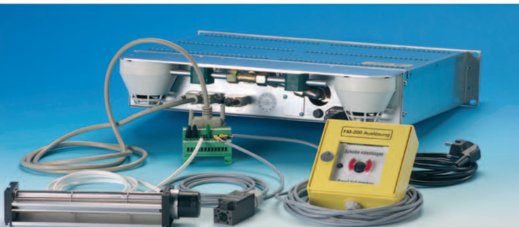
Lieferumfang: Übergabeverteiler, Löschlüfter und Türkontaktschalter sowie optionale Handauslösung