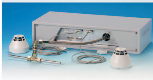
Zubehör zur Aufbauversion: Verlängerungskabel für Rauchmelder, Schottverschraubung und Anschluss- schlauch