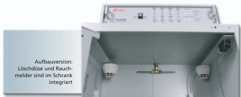
Aufbauversion: Löschdüse und Rauch- melder sind im Schrank integriert

Das PanelSafe 19"-System ist als Einbau- und als Aufbauversion verfügbar.