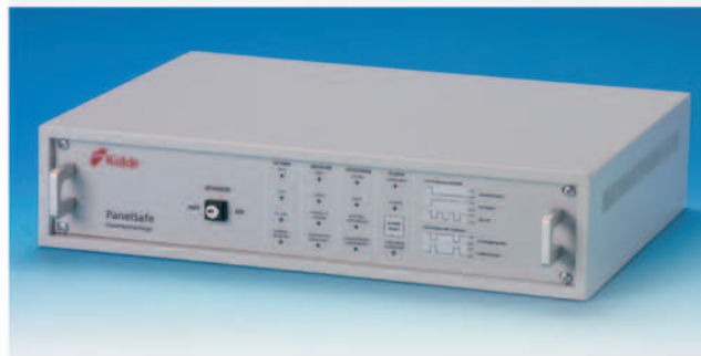
Master / Basisgerät Aufbauversion zur Montage auf Schränken mit entsprechendem Volumen