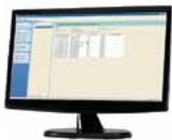
Software Kaba evolo manager