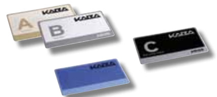
Kaba evolo Medien