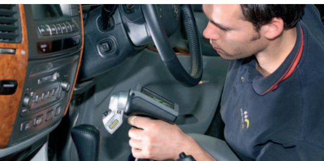
Die GapGun lässt sich für eine Vielzahl von Messaufgaben auch in engen oder schwer zugänglichen Räumen einsetzen.

Mit der GapGun von Third Dimension Software Ltd. bietet AICON ein zukunftsweisendes Lasermesssystem an, das mit bislang unerreichter Präzision und Wiederholgenauigkeit Spaltmaß, Bündigkeit, Radius und Versatz bestimmt. Durch einfache Handhabung und Rapid-Fire-Messungen kann der Bediener bis zu zehn Mal mehr Messungen pro Zeiteinheit durchführen als mit konventionellen Systemen. Kostspielige Speziallösungen wie Lehren, Messschieber, Tiefenmaße oder Kegellehren entfallen dabei vollständig. Da die berührungslos messende GapGun zudem an nahezu allen Oberflächen eingesetzt werden kann, nutzen weltweit führende Automobil- und Luftfahrtbetriebe das Lasermesssystem mittlerweile in den unterschiedlichsten Bereichen zur Qualitätssicherung.