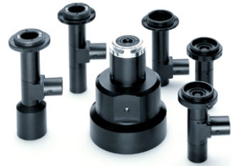
Baukleine telezentrische Objektive für Messaufgaben, Pick & Place-

Telezentrische Objektive besitzen meist eine Sehr gute Abbildungsqualität und werden für präzise, häufig auch automatisierte Vermessungsaufgaben eingesetzt. Die Besonderheit einer telezentrischen Abbildung liegt im parallelen Strahlengang. Objekte gleicher Größe, die sich unterschiedlich weit vor der Frontlinse befinden, werden daher in exakt der gleichen, also ihrer wahren Größe wiedergegeben.